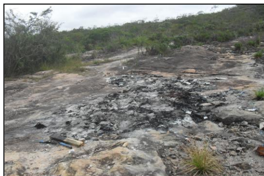
Figura 2: Lixo queimado na trilha. TANAN, 2011.

observar que muitos não as respeitam, pois ainda é encontrado lixo pelas trilhas e até mesmo o lixo queimado (Figura 2).