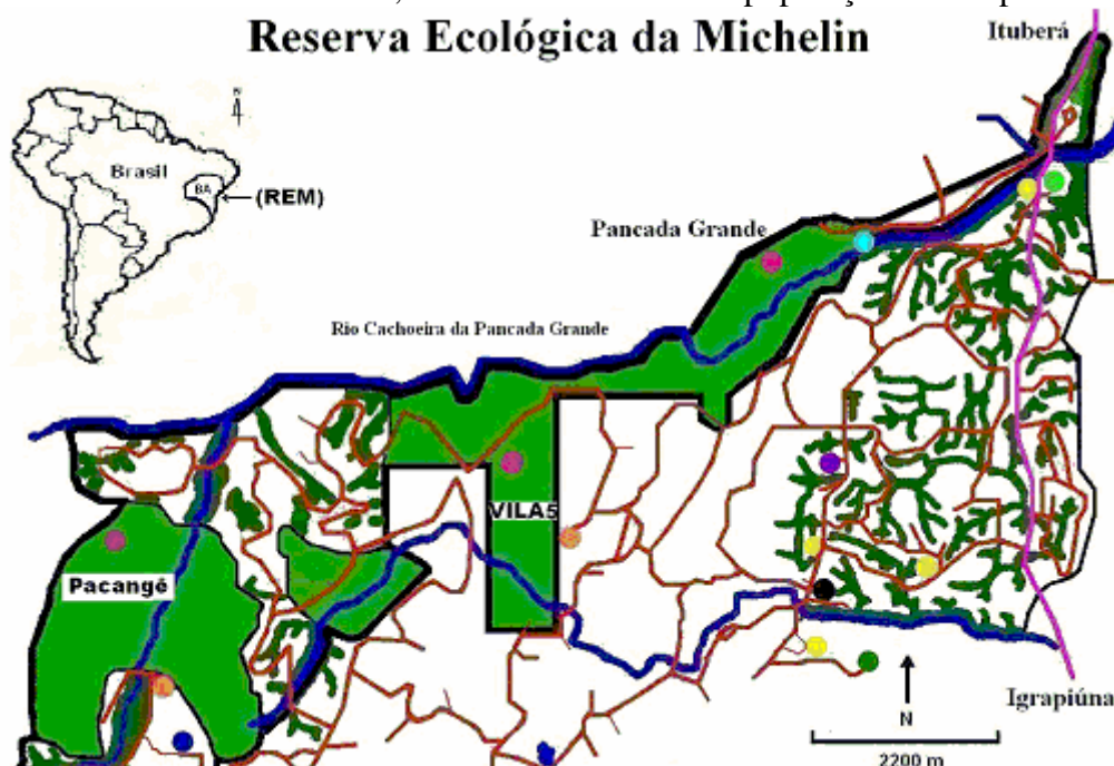
Figura 1: Reserva Ecológica da Michelin.

floresta ombrófila densa. O clima da área de estudo é úmido a subúmido (SIDE, 2010), com a precipitação média anual de 2.051 mm e temperaturas entre 18° e 30° C, com chuva durante o ano inteiro. Assim, o presente estudo foi realizado em dois fragmentos florestais, Mata de Pancada Grande e Mata de Vila Cinco, devido à ocorrência de populações das espécies.